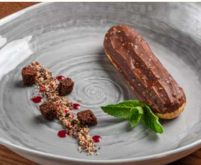
Эклер классический 45g / 270.-