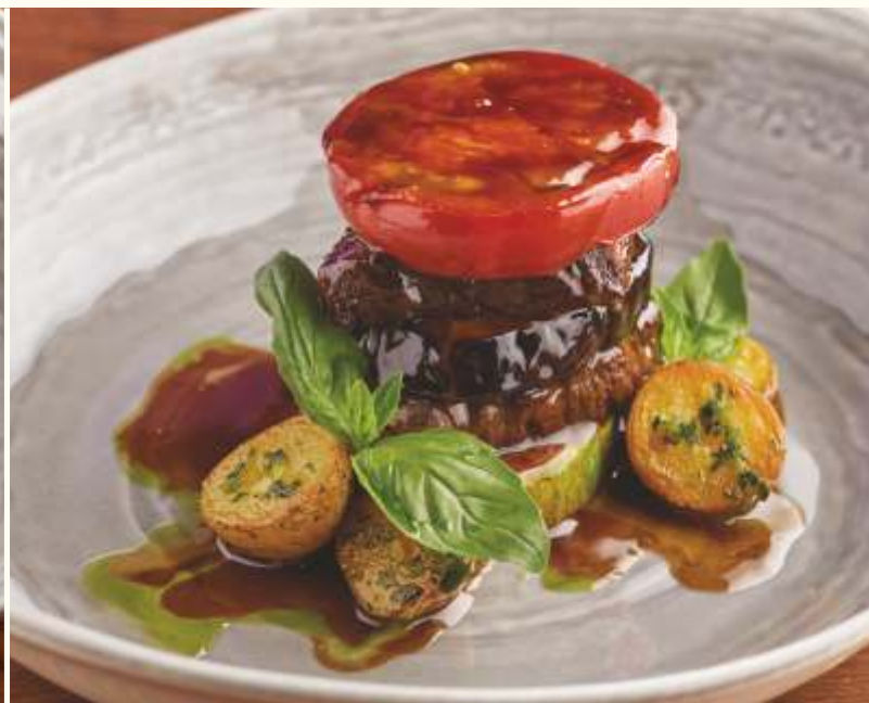
Медальоны с овощами гриль и трюфельным соусом 270g / 1290.-