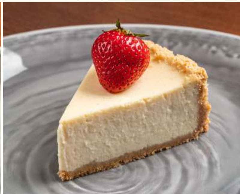
Сырный торт 120g / 350.-