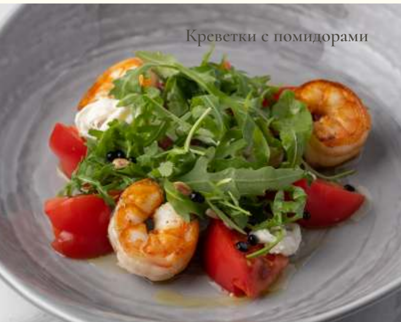
Креветки с помидорами