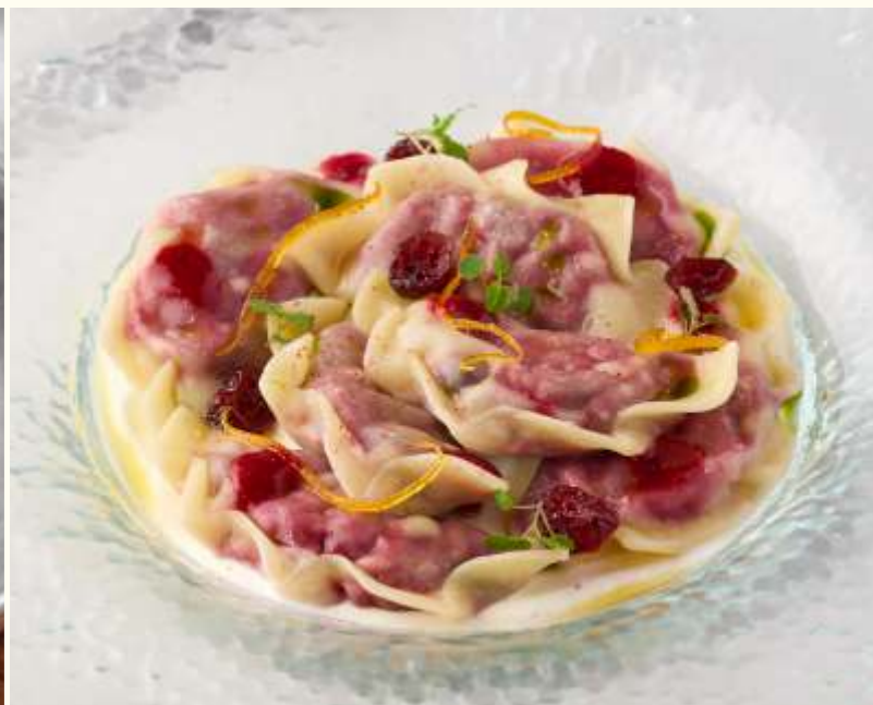
Вареники с вишней 200g / 690.-

Мороженое на выбор: ванильное/шоколадное/страчателла 50g / 150.-