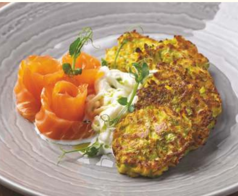
Оладьи из кабачков с лососем и страчателлой 190g / 1250.-