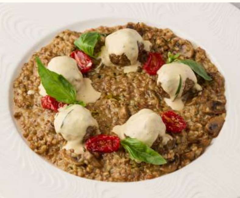
Польпетте из говядины с грибным гречотто 320g / 880.-