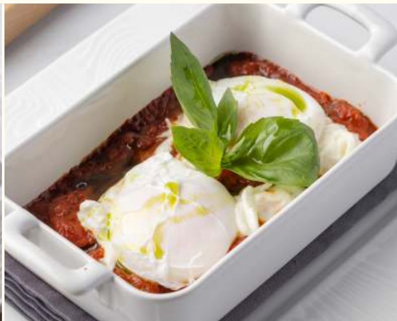
Яйца пашот со страчателлой и томатно-перечным рагу 270g / 630.-