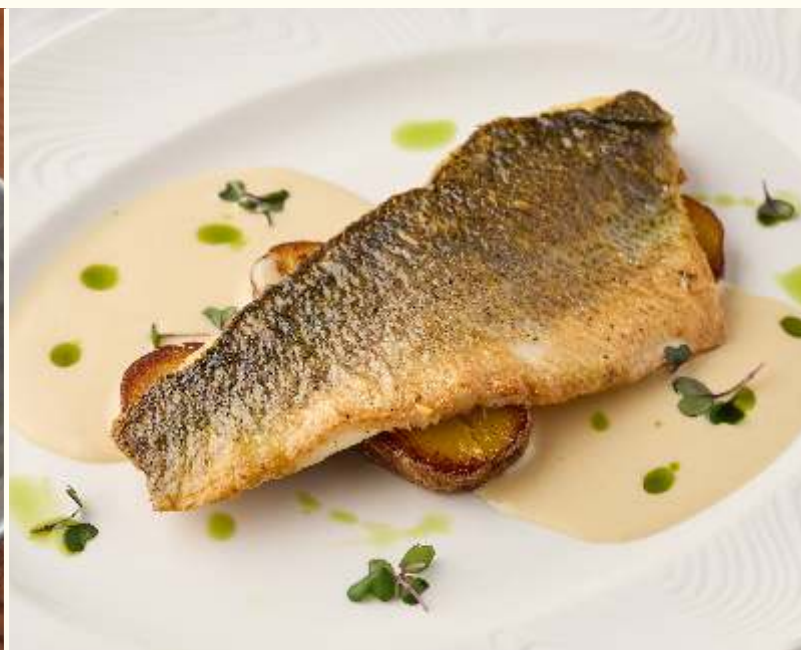
Сибас с беби-картофелем и соусом из шардоне 200g / 1250.-

Если у вас есть аллергия на определенные продукты, просим заранее сообщить об этом официанту.