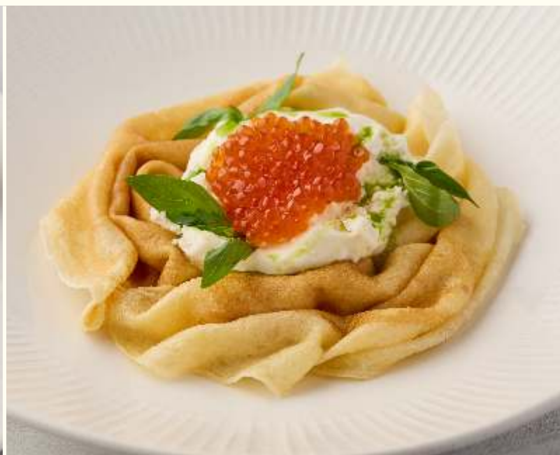
Красная икра с яйцом пашот на блинчиках 160g / 950.-

Если у вас есть аллергия на определенные продукты, просим заранее сообщить об этом официанту.