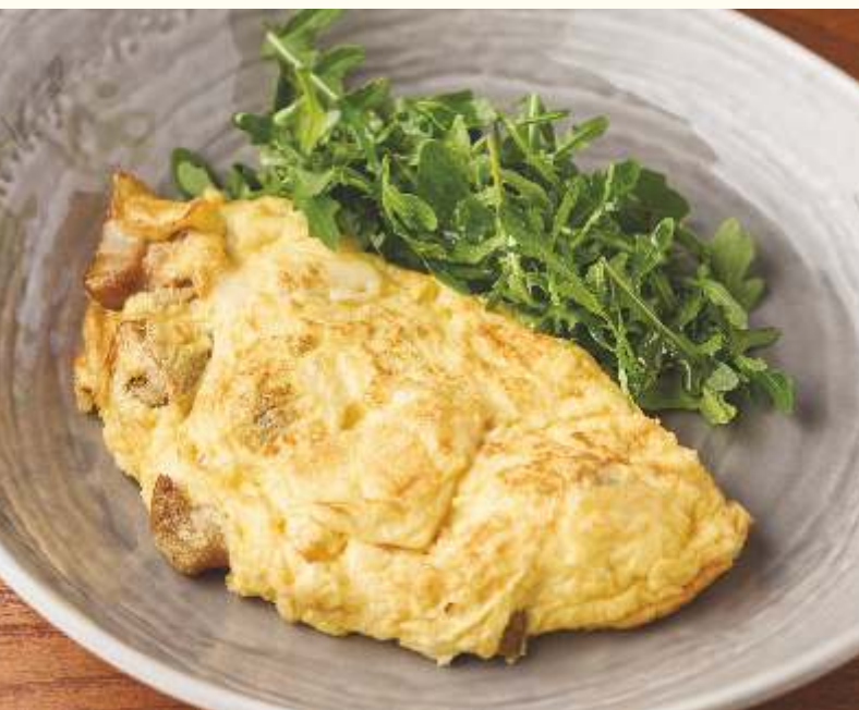
Омлет с белыми грибами и сыром бри 170g / 590.-