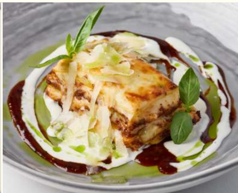
Лазанья Болоньезе 180g / 750.-

Если у вас есть аллергия на определенные продукты, просим заранее сообщить об этом официанту.