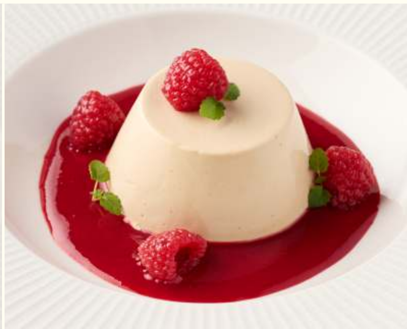
Кофейная панна котта 195g / 650.-