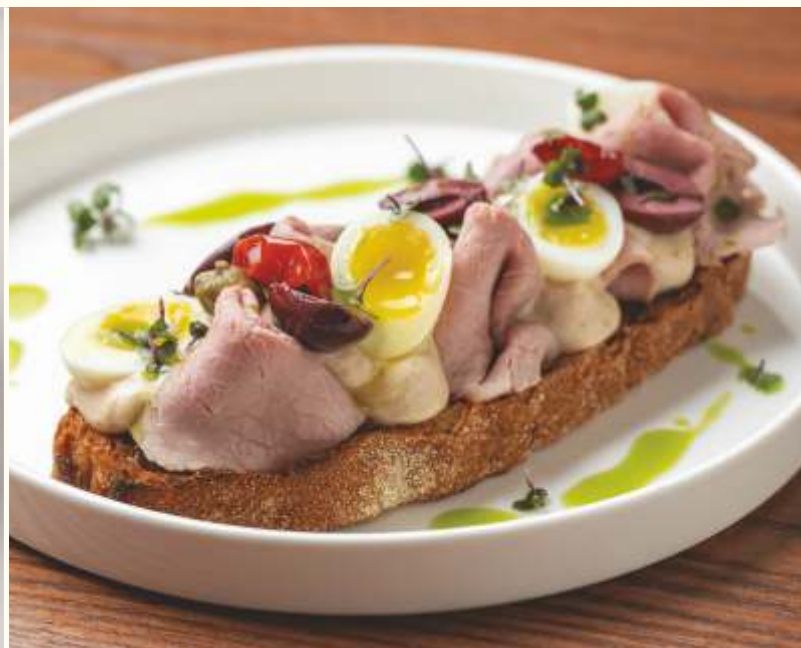
Главная брускетта Пьемонта Вителло Тоннато 120g / 620.-