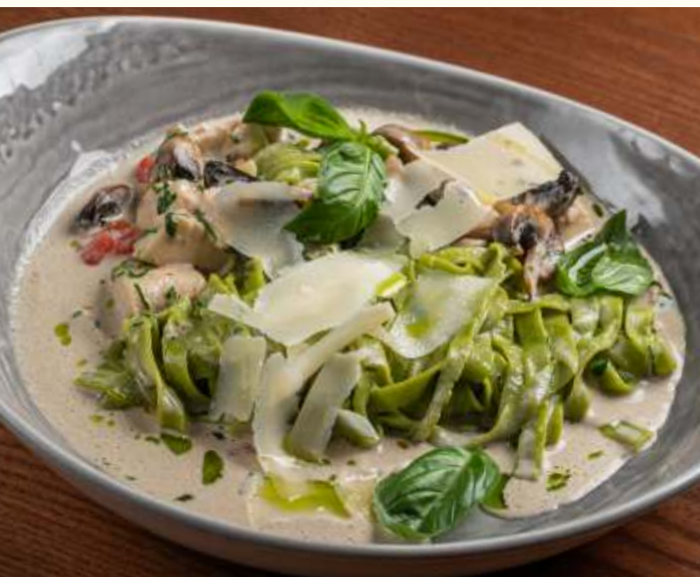
Зелёные фетучини с курицей и грибами 300g / 780.-