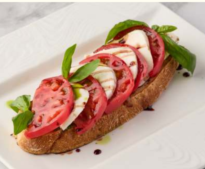
Брускетта с острова Капри 160g / 650.-