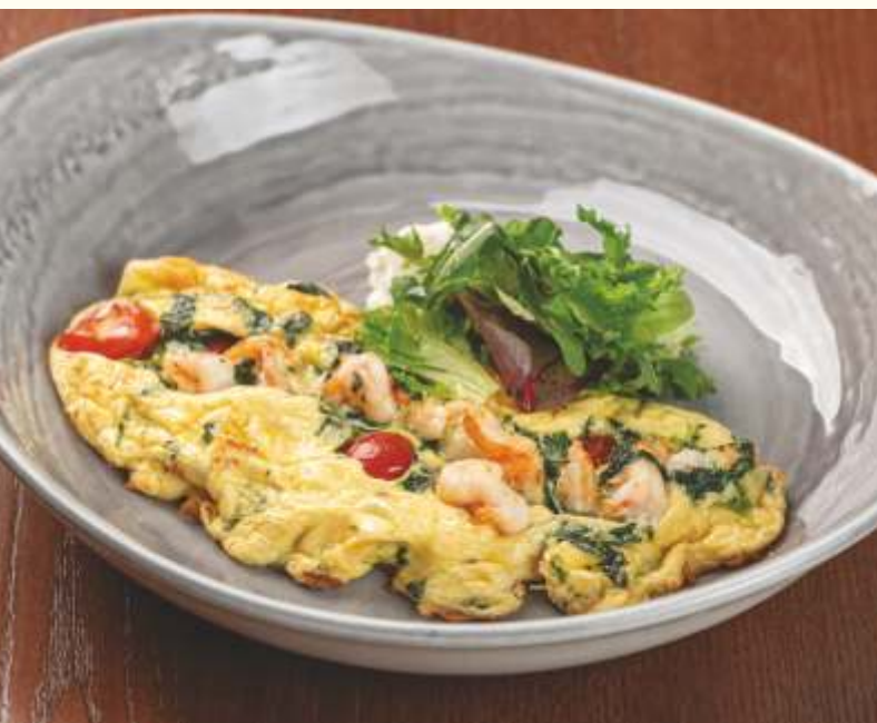
Фриттата с креветками и шпинатом 220g / 620.-