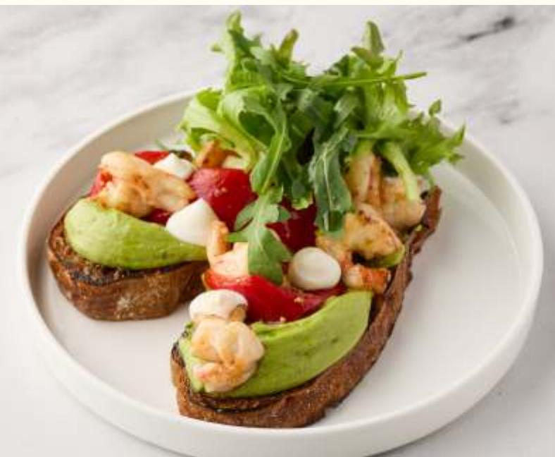
Брускетта с креветками и гуакамоле 200g / 980.-