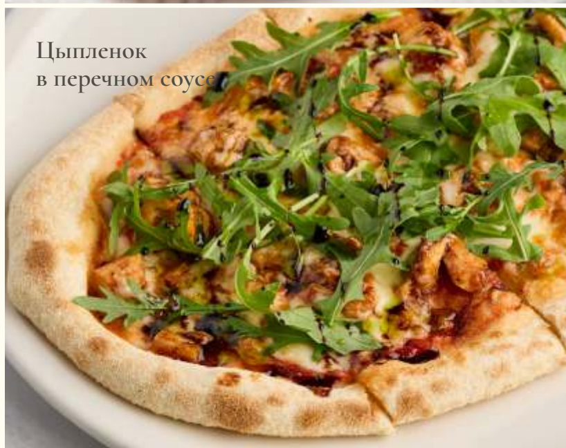
Цыпленок в перечном соусе