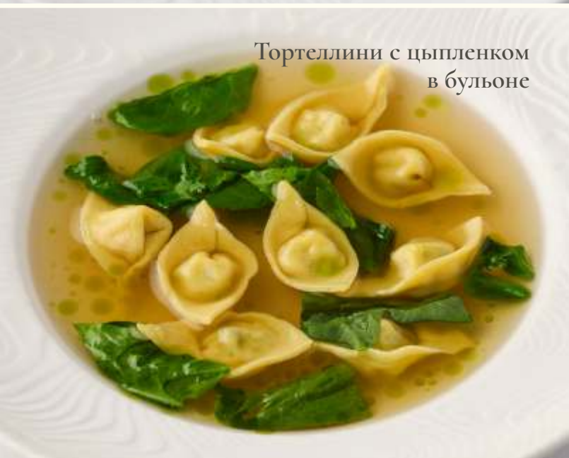
Тортеллини с цыпленком в бульоне