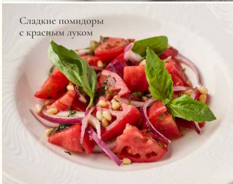
Сладкие помидоры с красным луком