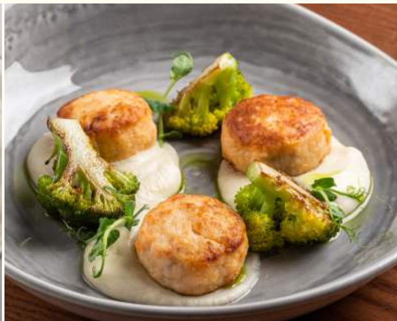
Котлеты из лосося и креветок с пюре из сельдерея 200g / 1290.-