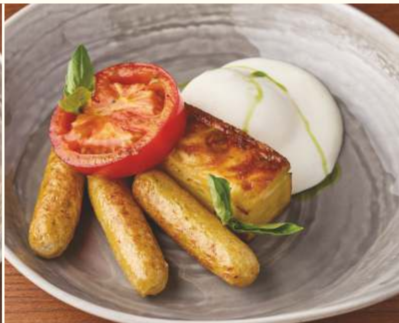
Куриные колбаски с гратеном и яйцом пашот 280g / 890.-