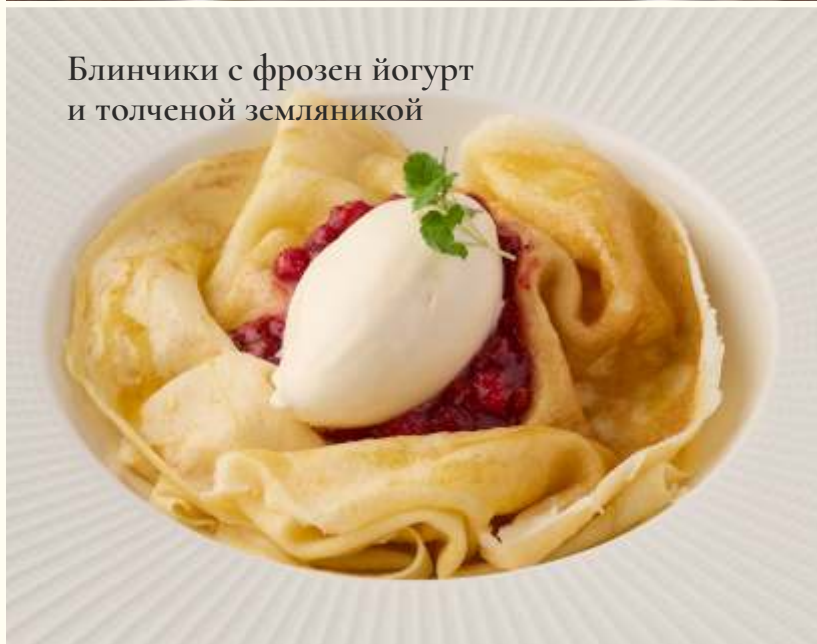
Блинчики с фрозен йогурт и толченой земляникой