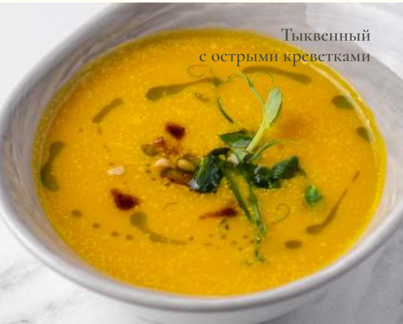
Тыквенный с острыми креветками