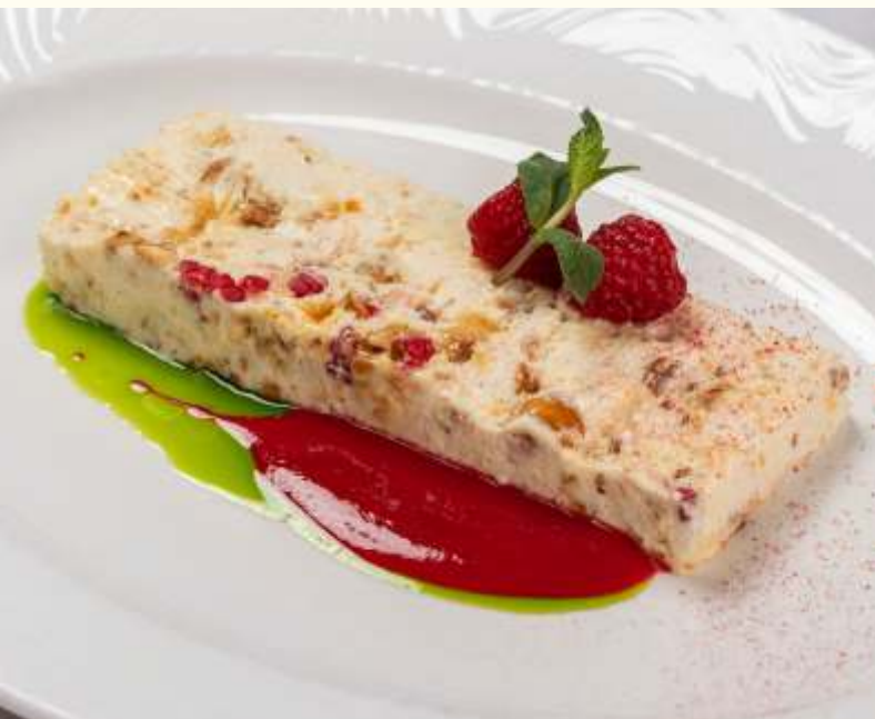
Семифредо с малиной и фундуком 185g / 550.-