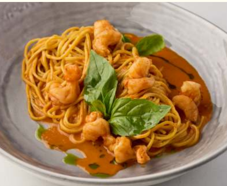
Креветки с лингвини в соусе маринара 260g / 750.-