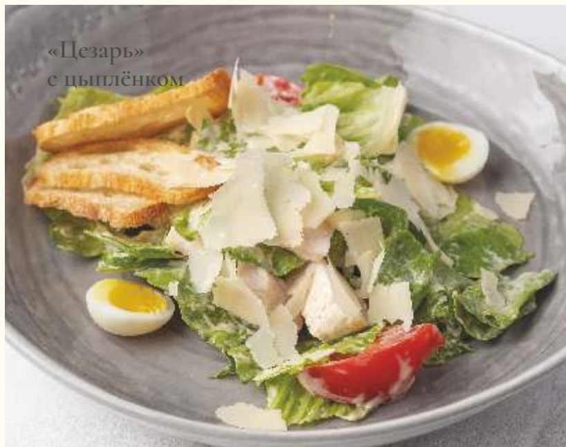
«Цезарь» с цыплёнком