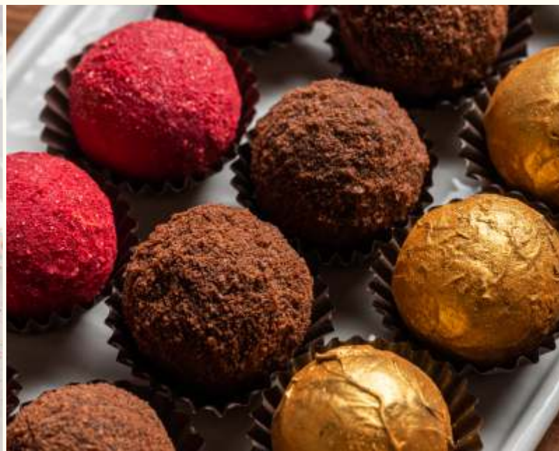
Конфеты в ассортименте 20g / 190.-

Сорбеты на выбор: малина/лимон 50g / 250.-