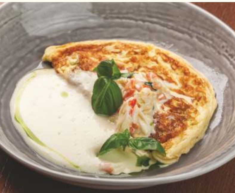
Омлет с крабом и муссом пармезан 200g / 1290.-