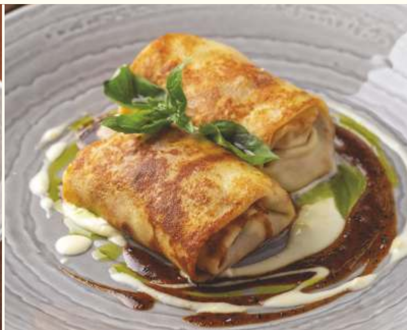
Блинчики с грибами и цыпленком с соусом бешамель 230g / 750.-

Если у вас есть аллергия на определенные продукты, просим заранее сообщить об этом официанту.