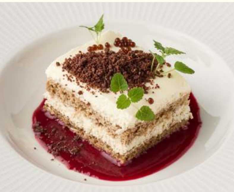
Тирамису с ликёром амаретто 140g / 470.-