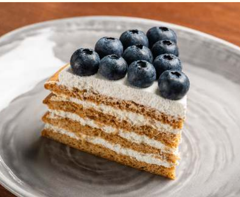
Сметанник 120g / 420.-