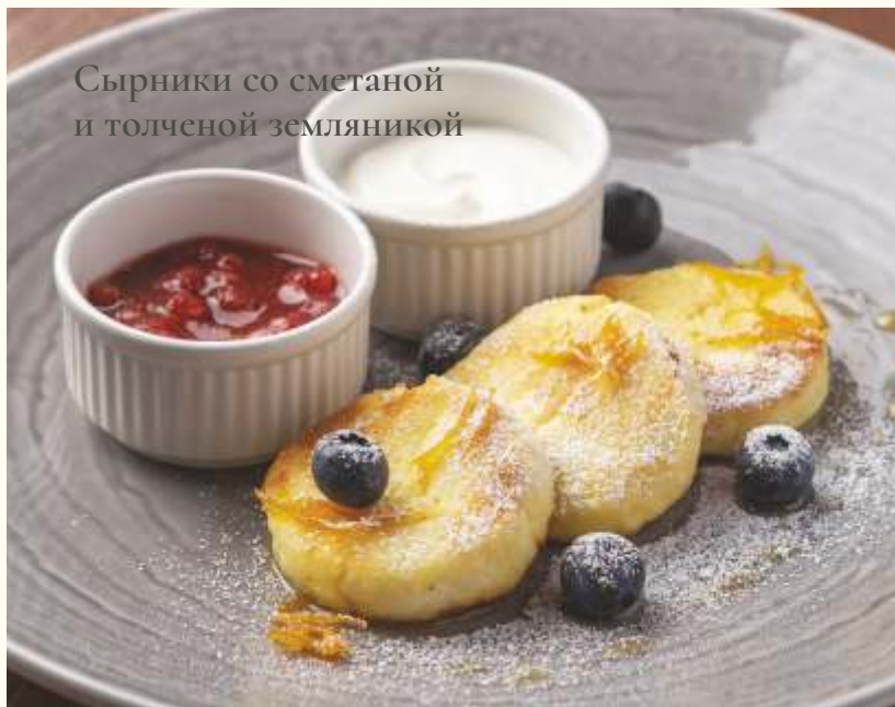
Сырники со сметаной и толченой земляникой