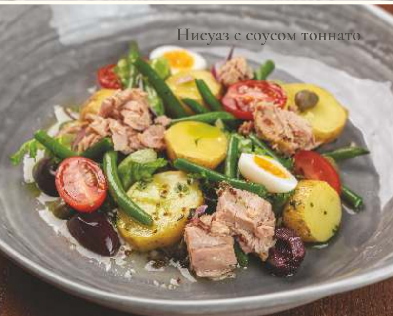
Нисуаз с соусом тоннато